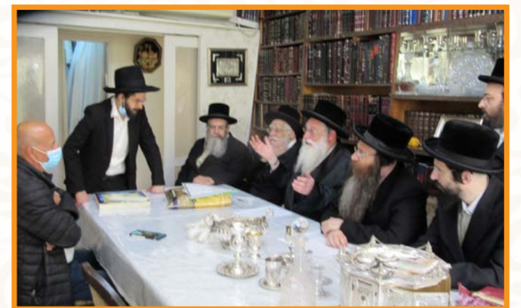
הרבנים שליט"א חברי הבר"ץ במכירת חמץ, ניסן תשפ"א