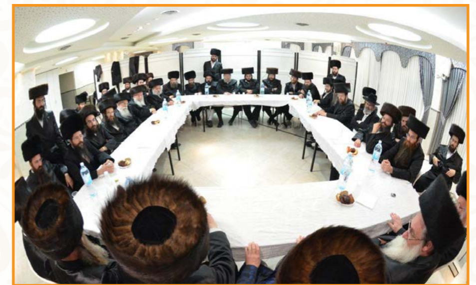
מעמד יסוד בד"ץ הרבנים