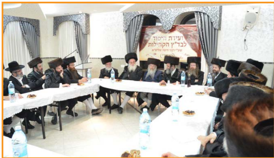
מעמד יסוד בד"ץ הרבנים

עין בעין רואים פעילי הבד"ץ וועד הכשרות סייעתא דשמיא מיוחדת, לכך שיראי השם המדקדקים קלה כבחמורה יוכלו למצוא את מבוקשם ולהדר במזונם.