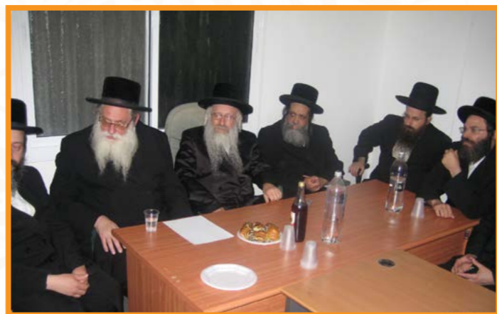
אסיפת הרבנים שליט"א בשנת יסוד הבר"ץ, לכוון עיר על תולה